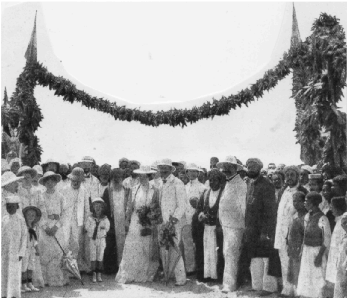
Ankunft einer deutschen Braut in Togo

Wiederholt hörte der Berichterstatter die Ansicht, dass Kindergärten in Südwest nicht nötig seien, weil die Mütter dort mehr Dienstboten und deshalb Zeit genug hätten, sich allein um ihre Kinder zu kümmern. Man brauche sie also nicht in Kindergärten zu schicken. „Dem möchte ich aber entgegenhalten, dass diese Dienstboten fast ausschließlich Eingeborene sind, die der ständigen Überwachung der Hausfrau bedürfen. Die Kinder müssen oft der Betreuung durch schwarze Dienstboten überlassen werden. Es führt dazu, dass viele Kleinkinder die Stammsprache der Eingeborenen eher erlernen als die deutsche Muttersprache!“