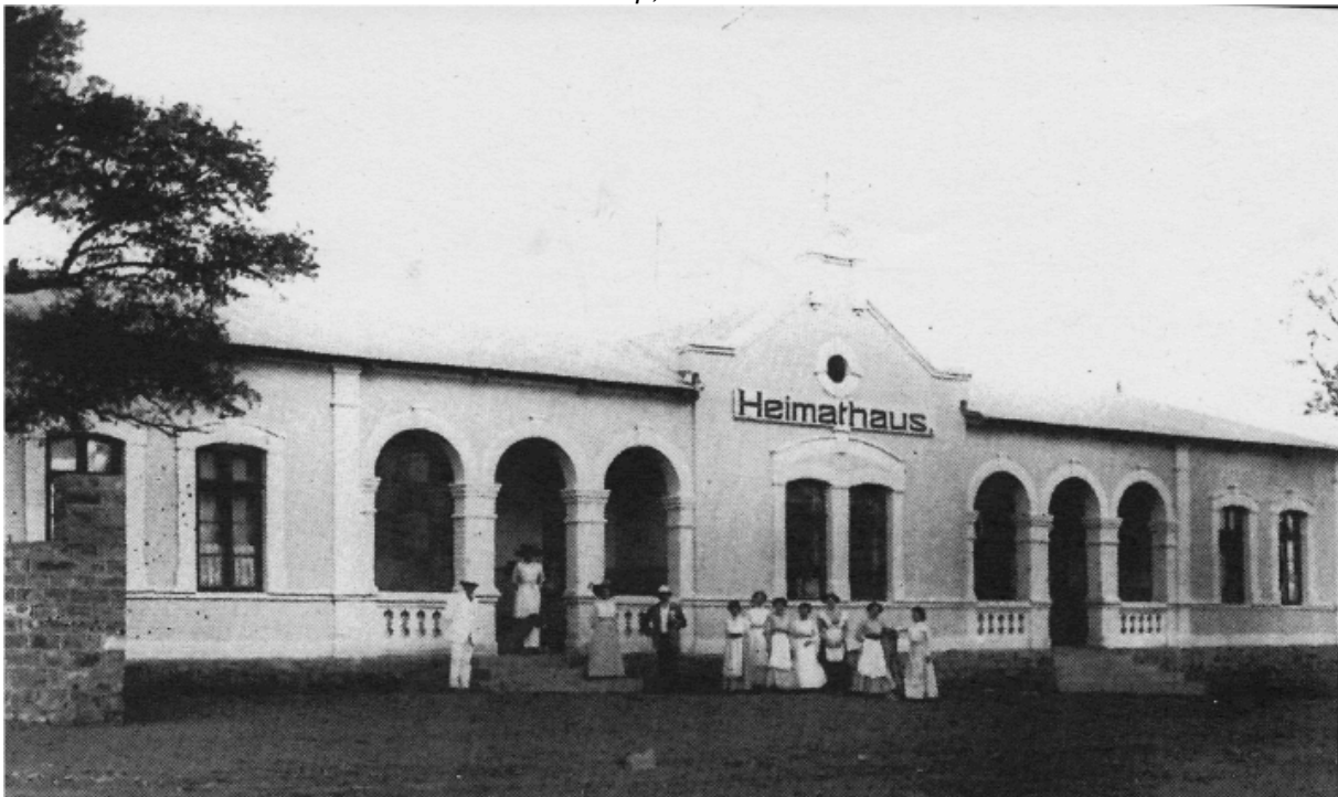
Heimathaus des Frauenbundes in Keetmanshoop; 1910