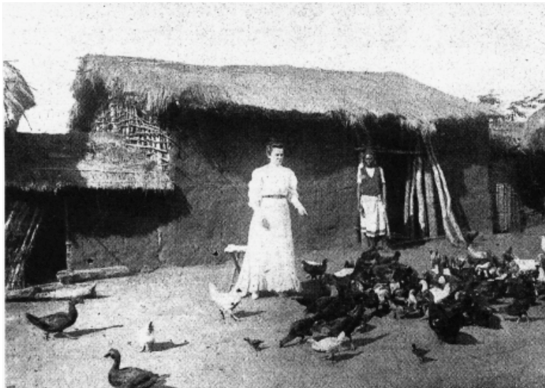
Auf einem Hühnerhof in Deutsch-Ostafrika: das lange weiße Kleid war ohne Zweifel schmutzempfindlich...